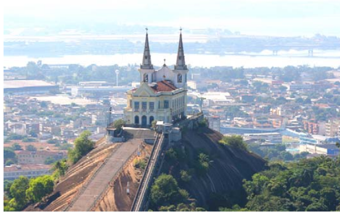
Figura 2: Igreja da Penha

Apesar de o caráter religioso dar os contornos oficiais ao evento, a Festa da Penha na verdade são duas. A originária, de cunho sagrado, acontece predominantemente “em cima”, e a festa “profana” e divertida é celebrada “embaixo”. É lá embaixo onde a cidade pulsa, onde o espaço público é apropriado por diferentes atividades, dotando a festa de um caráter cultural que vai além da religião, marcado pela música, pela capoeira, entre outras práticas populares espontâneas. A união das duas festas se materializa através dos percursos de seus usuários, sejam romeiros, sejam participantes em busca de diversão, os quais atravessam e unificam todos os espaços.